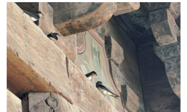
봉정사 대웅전 처마위의 제비 5마리

강남 갔다가 4월 초쯤 우리나라에 오는 봄의 전령사 제비가 봉정사 대웅전에 자리 잡은 건 무슨 연유일까?