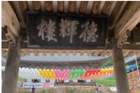
봉정사 만세루에 걸린 덕회루 현판