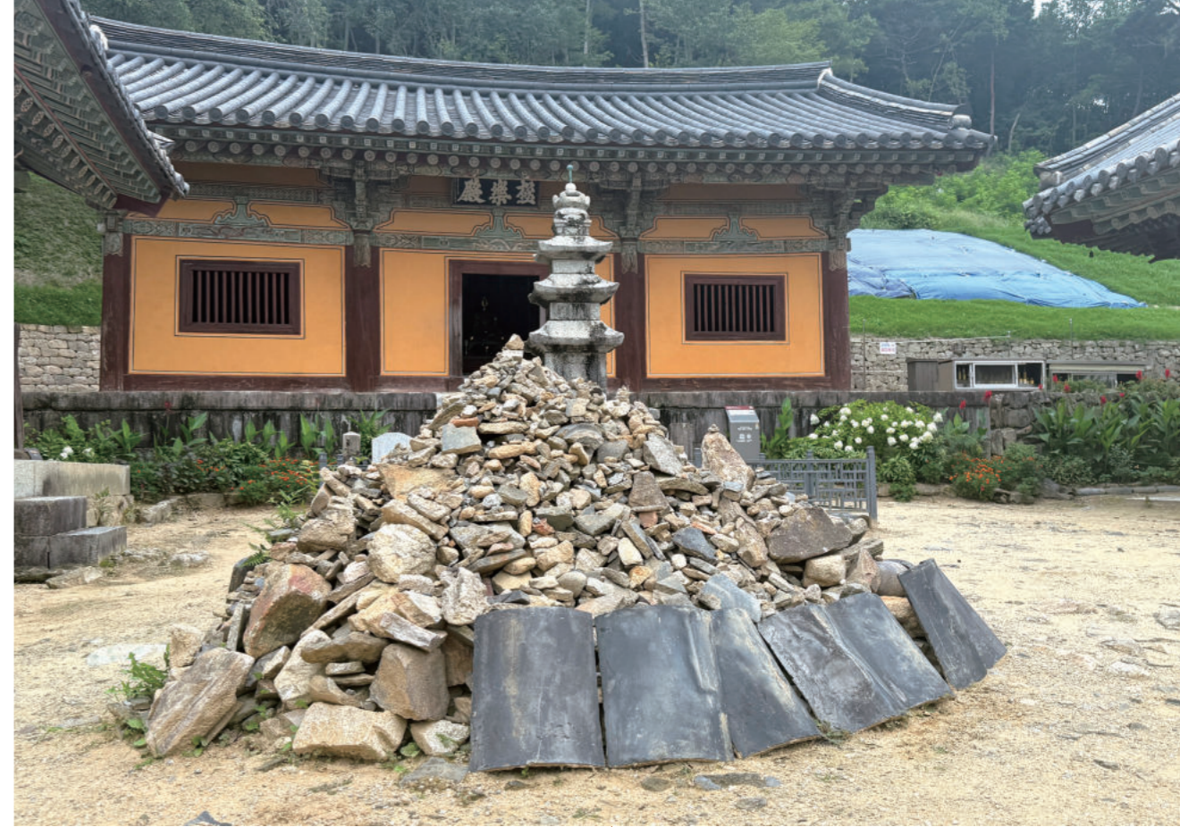
봉정사 극락전과 앞에 있는 돌탑

불교에서 ‘마음을 구성하는 식(識) 가운데 일곱 번째인 말나식과 여덟 번째인 아뢰야식을 인용해 여왕의 마음을 풀이한 게 순례자로서 선뜻 이해하기 어렵지만 그래도 불교 신문다운 해석이라는 생각도 든다.