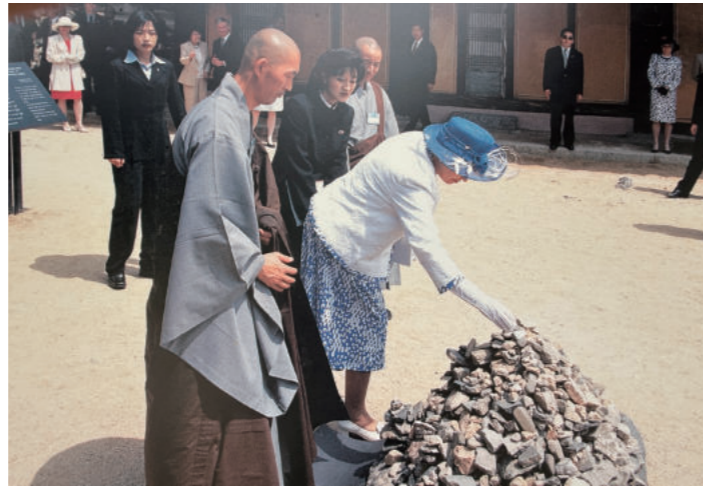
봉정사 극락전 앞 돌탑에 돌 놓는 영국 여왕과 일행