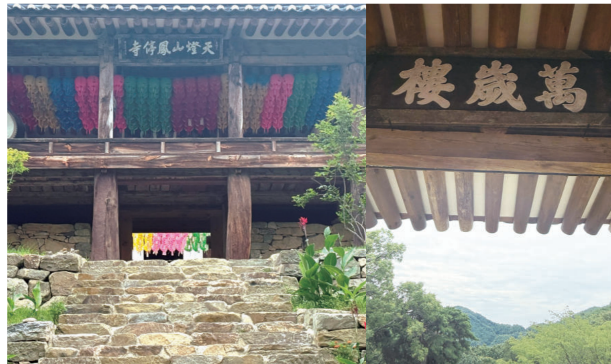
천등산 봉정사 현판을 단 만세루(덕회루)

봉황과 영국 여왕, 독립 운동가의 사연이 교차하는 봉정사. 언제라도 한 번쯤 가서 찬찬히 돌아볼 만한 우리의 세계유산이다. 제비가 강남에서 오는 봄날이면 더 좋겠다. 🇰🇷