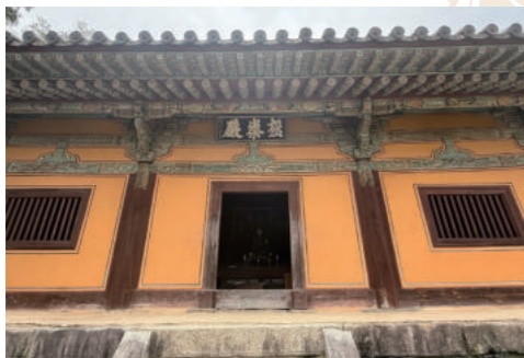
봉정사 극락전 아래서 본 정면