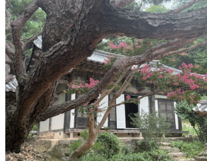
봉정사 영산암 내부 모습

나라가 부서지고 임금이 없어지며 사직이 고꾸라졌기에 (國破君亡社稷傾) 부끄러움을 꺼안고 죽지 않고 참아서, 지금에 이르기까지 살아있네(包羞忍死至今生) 그러나 늙은이 마음은 오히려 하늘을 찌를 뜻은 있어 (老心尚有衝霄志) 일거에 힘차게 날아올라 만 리는 갈 수가 있네. (一舉雄飛萬里行)