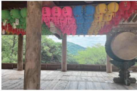
봉정사 만세루에 올라 바라본 산하