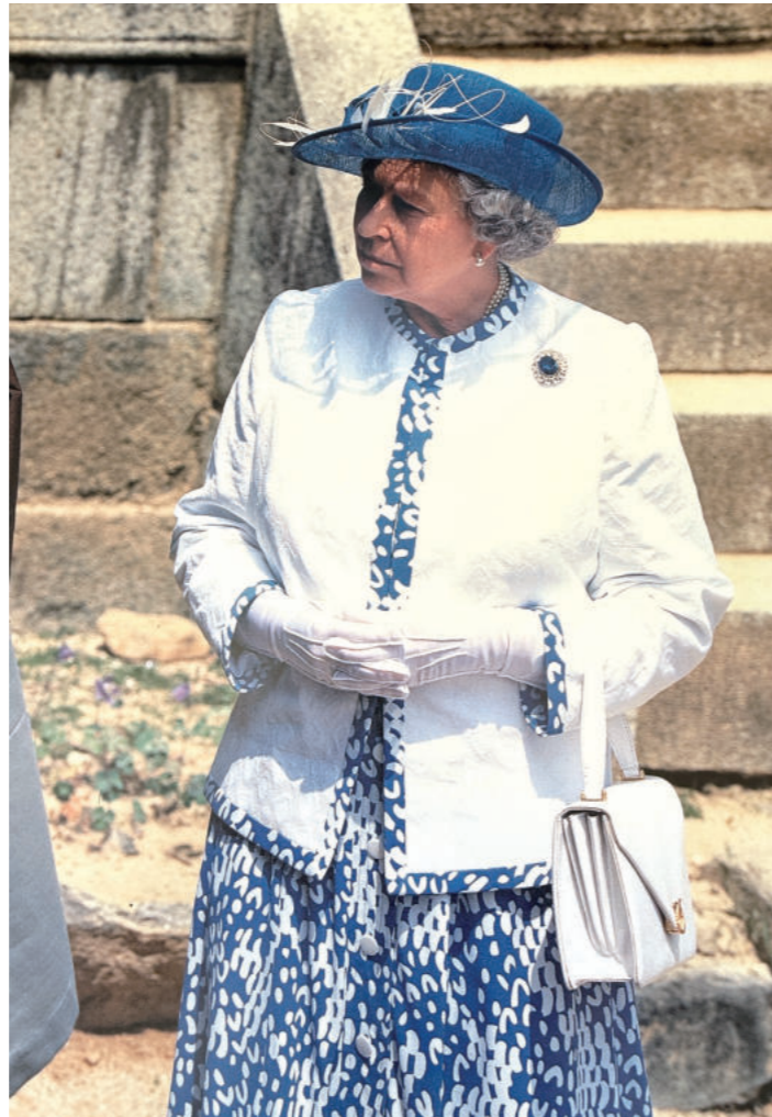
봉정사 방문한 영국 여왕의 모습